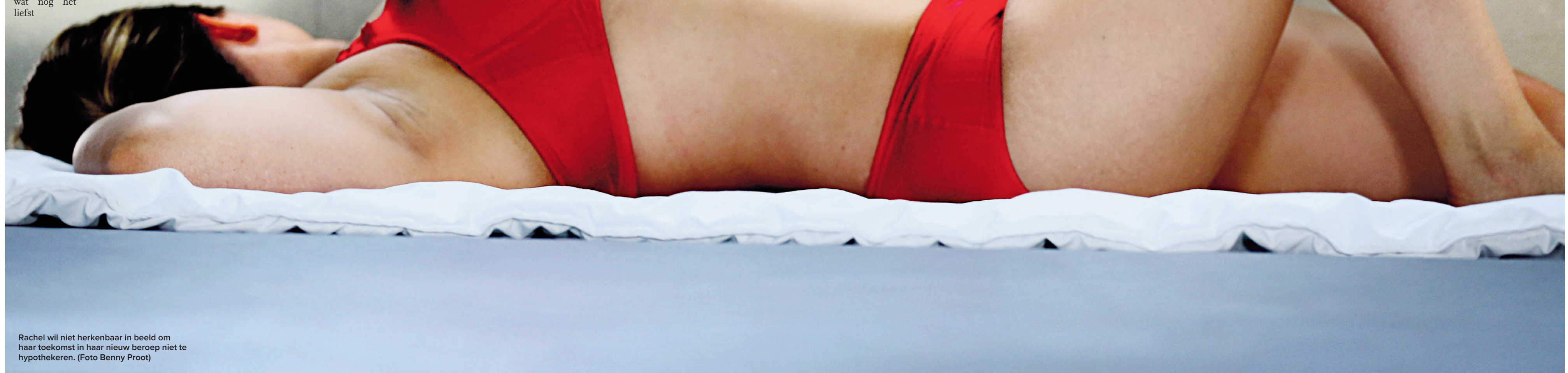
Rachel wil niet herkenbaar in beeld om haar toekomst in haar nieuw beroep niet te hypothekeren.

Een organisatie die prostituees begeleidt en ondersteunt, vindt ze niet minder dan een must: “Je staat er verstoeld van hoe weinig veel meisjes weten over veilig vrijen en hygiëne, laat staan over hoe ze de zaken best financieel aanpakken of hoe ze mentaal met deze job moeten omgaan. Daarom kan er binnen de CAW’s ( Centra voor Algemeen Welzijnswerk, red. ) die al in elke stad bestaan, niet een afdeling voorzien worden om vrouwen die overwegen om in de prostitutie te stappen, te informeren, te begeleiden en zo nodig door te verwijzen?”