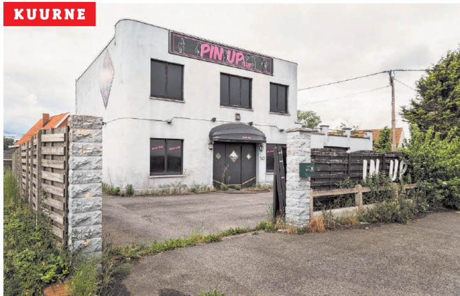
De Pin Up Club in de Brugsesteenweg staat er leeg en troosteloos bij.