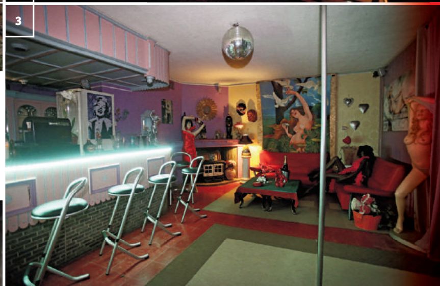
1. Een al dan niet bevallige SM-meesteres moet langs de Bruggesteenweg in Egem klanten lokken voor Le Ciel Flamand. 2. Le Ciel Flamand beschikt, zoals het een borddeel met enige reputatie betaamt, over een zogenaamde 'séparé', die met een gordijn afgesloten kan worden. 3. De bar van het borddeel, inclusief danspaal en enkele etalagepoppen. "Zo heb je het gevoel dat je hier niet alleen zit", zegt uitbater John. 4. De aanpalende SM-kamer, waar, volgens uitbater John, alle mogelijke fantasieën werkelijkheid worden. Merk vooral de matenklopper op. 5. De sensuele kamer, met fluweelrode plafondbekleding. En industriële airconditioning.