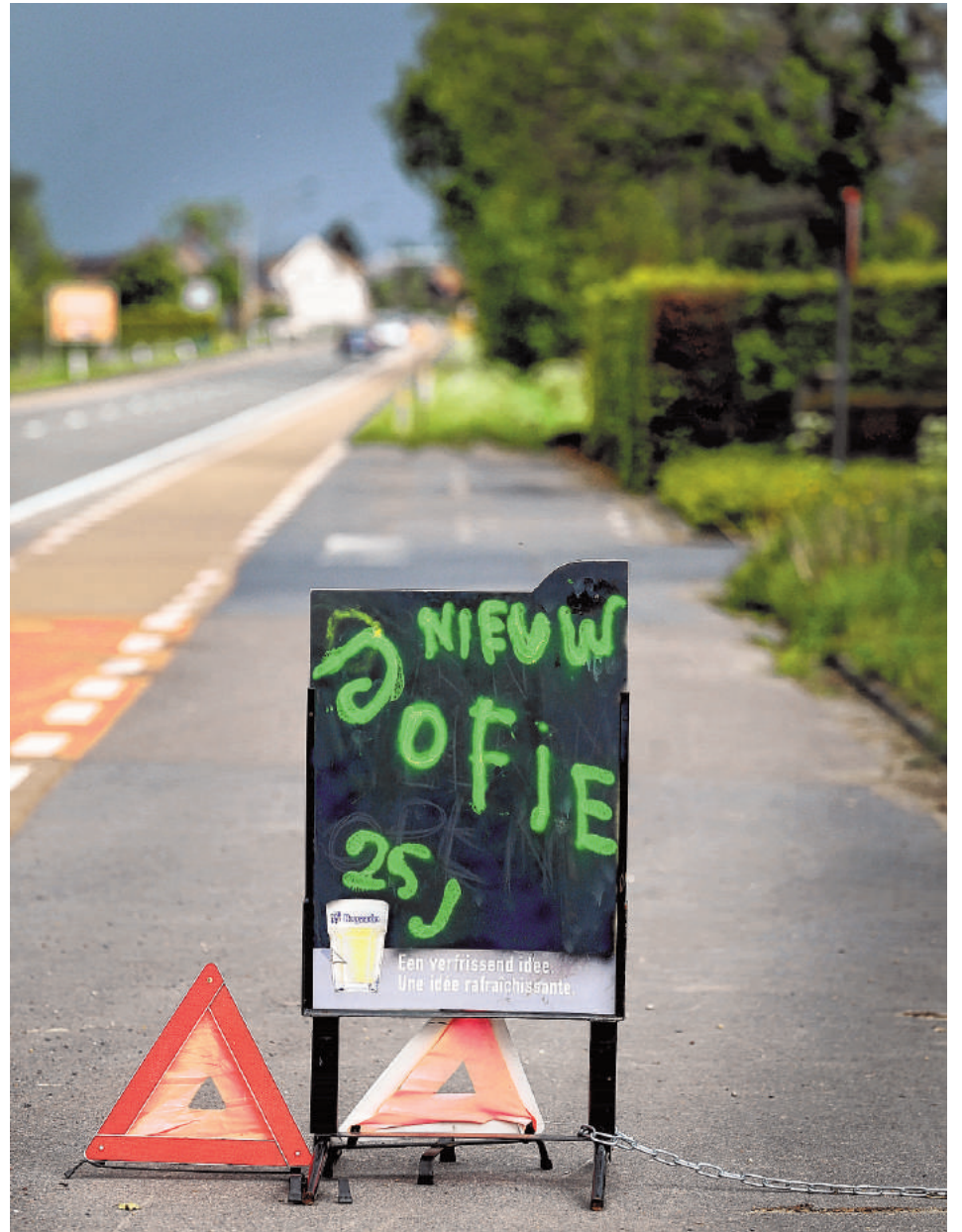
“Als je twijfels hebt over de leeftijd van een meisje, bel de politie”, zegt het parket.

Alert zijn, is de boodschap. Al ligt het misbruik er soms ook vingerdik op.