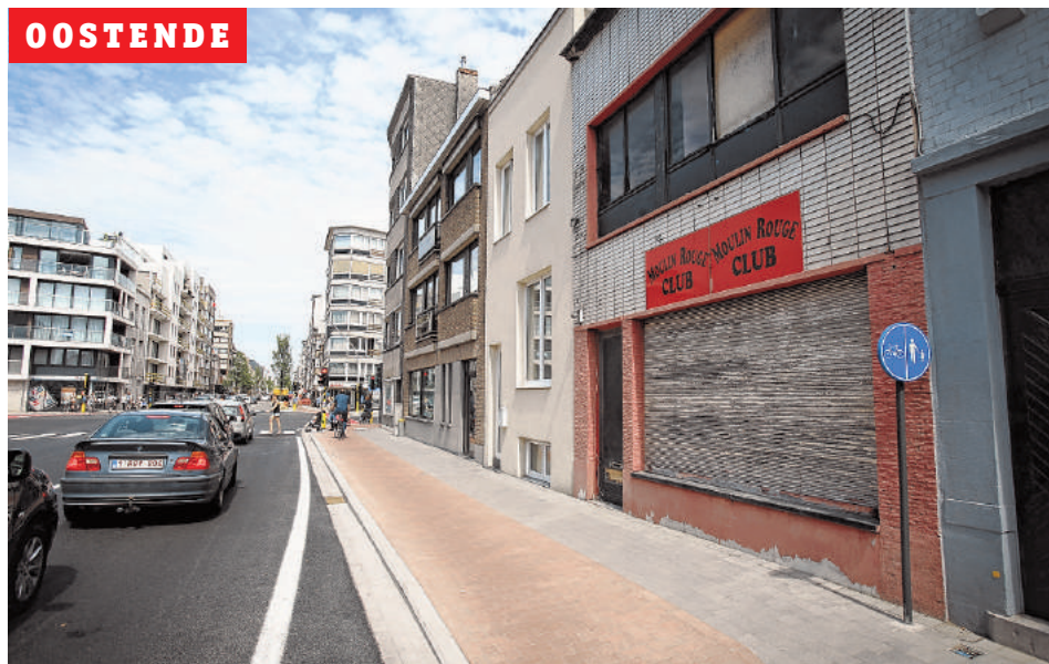
De rolluiken van de Moulin Rouge Club langs de Torhoutsesteenweg blijven dicht.

gemeentebesturen 'opgekuist', om onveiligheid en overlast tegen te gaan. Vaak op vraag van burens en bouwpromotoren. "Na lang gedoogd te zijn geweest, is het van de ene op de andere dag plots een probleem", vertelt iemand uit de sector. "Veelal wordt het protest georkestreerd. De burens hebben hun woning in een weinig aantrekkelijke buurt voor een lage prijs kunnen kopen en