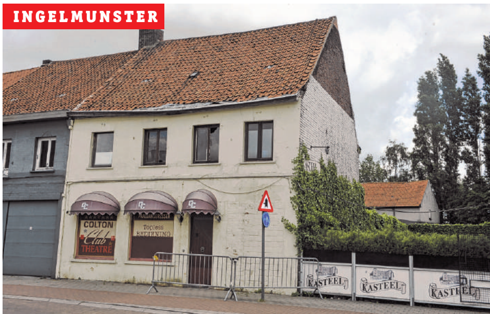
De gevel van de Colton Club in de Bruggestraat is aan het afbrokkelen.