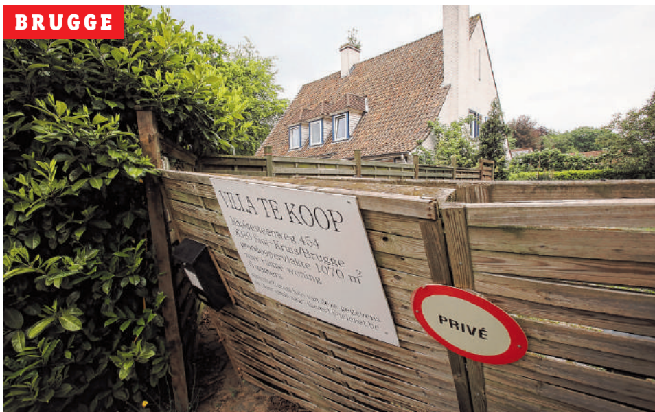
Club Trésor langs de Maalse Steenweg staat al maanden te koop.

Ze bestaan nog, de 'kotjes', maar worden steeds schaarser. Niet dat prostitutie afneemt, alleen wordt ze almaar minder zichtbaar in het straatbeeld. Prostituees prijzen zich aan op het internet en werken van thuis uit, een onopvallend rijhuis of appartement, zonder rode lichtjes. Uit het zicht, van alles en iedereen.