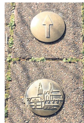
De wandelroute is bewegwijzerd met deze klinknagels.

We nemen L de Pannestraat en daarna tegenover de Blauwe Nonnenstraat het smalle Scholasterstraatje. Zo komen we opnieuw in het Sint-Walburgapark en bereiken we langs de kerk ons startpunt.