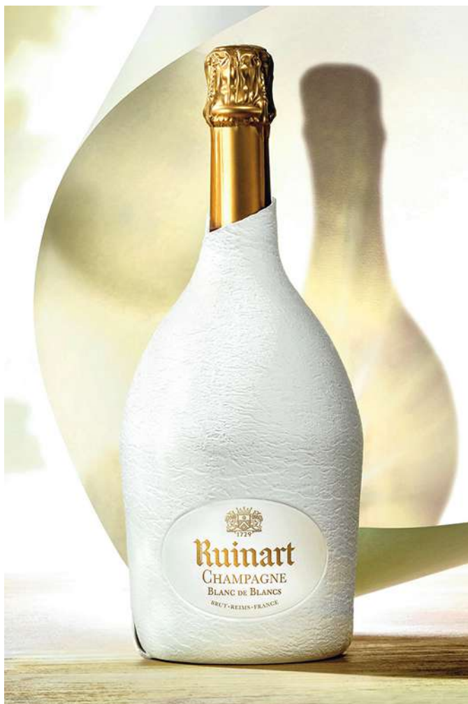
De verpakking in gegoten papierpulp is een innovatie van James Cropper.

werd. Het gaat om een verpakking in één materiaal, namelijk Colourform (papierpulp die in een mal een vorm gekregen heeft), dat als etui diende voor de champagne van het Maison Ruinart et Pusterla 1880 en een alternatief vormde voor kunststof etuis. In vergelijking met de vorige kunststof verpakking, is de nieuwe papieren versie negen keer lichter en vermindert ze de koolstofafdruk met 60 procent. Het ontwerp werd tijdens de wedstrijd bekroond omdat het een nieuwe norm stelde op het vlak van verantwoorde luxeverpakkingen. In 2020 had James Cropper ook al Rydal uitgewerk